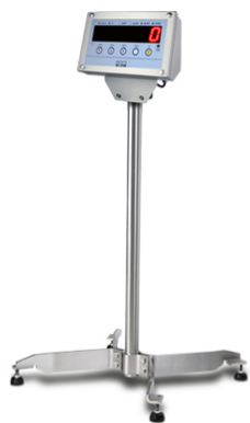
Colonna porta indicatore